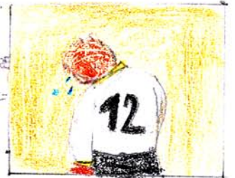
IL PORTIERE DEL MARTIGNACCO (GNACCO) DISPERATO.

Zampa: «il rigore non c'era» ma non c'era