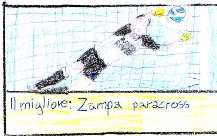
Il migliore: Zampa paracross